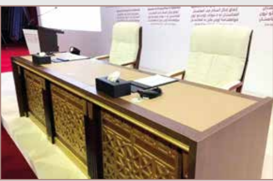
پاتې برخه...۳ مخ

په دې تړون کې يرغلگر اړ کړای شول چې دوی او ټول متحدين به يې له افغانستانه وځي، د افغانستان په کورنيو چارو کې به مداخله نه کوي، د افغانستان خاوره به د هېڅ بهرني ځواک تر واک لاندې نه وي، امريکا ومنله چې د جگړې پر ځای، مذاکرات يوازينی حل لاره ده. دا هغه څه وو چې اسلامي امارت له لومړي سره پرې